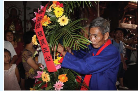
香菇始祖吴三公朝圣中菇民敬献花篮