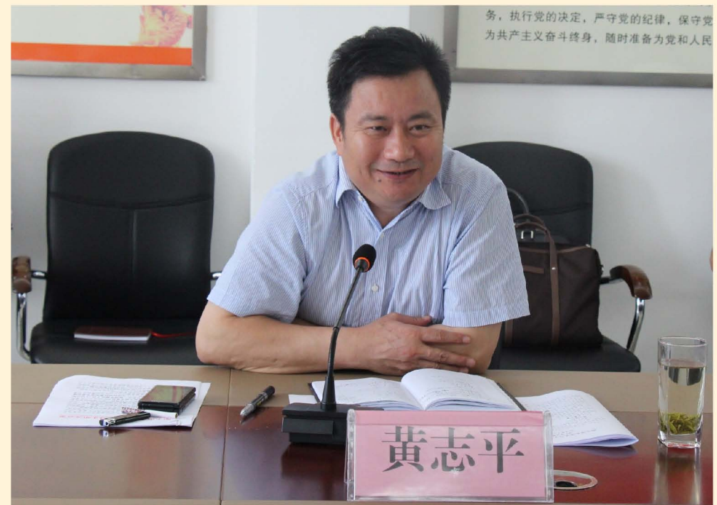
黄志平在市安监局调研

最后，黄志平对遂昌6·27洪灾抗洪救灾工作给予了充分肯定，并强调要尽全力抓好灾后重建工作，尽最大努力保障灾区群众的基本生活需求，确保灾民有房住，有衣穿，有饭吃，病能治；要千方百计地推进水毁工程的修复，加快重点基础设施建设进度，及早恢复群众的正常生产生活。同时，要全面落实好防汛责任制，确保安全度汛。