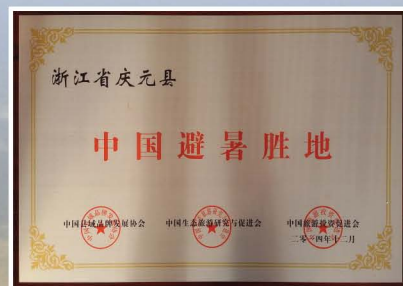
中国避暑胜地牌匾