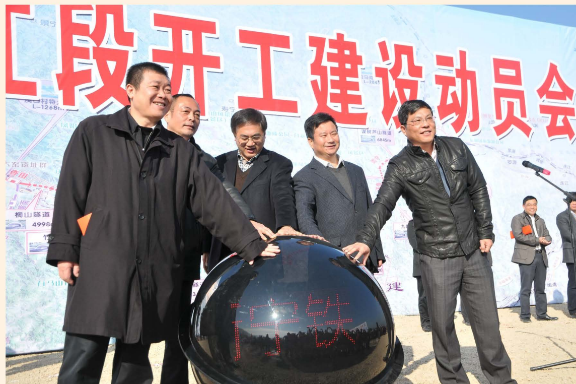
开工建设动员会现场