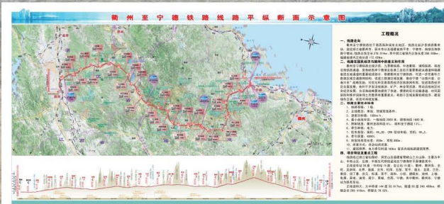
衢宁铁路线路平纵断面示意图