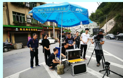
拍摄微电影宣传边界治水

五是“天网工程”变堵为通。将公安110和数字城管平台96345作为监督治水的投诉呼号,结合网络问政直通车、微信、便民信箱等举报平台,建立起“统一指挥、快速处置”的治水监管联动体系,全县七大水系主河段设立监控点60个,建立“5+X”处置模式,畅通涉水问题处置渠道。