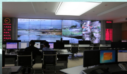
织拉一张“天网”,水情监管全覆盖