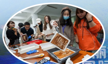
体验古典摄影工艺